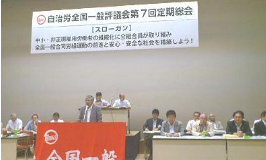
大会で挨拶する大浦議長

議長に就任して2期、 全国的に自治労と統合し て2年を迎えようとして いるが、いまだに3県問 題が解決していないこと